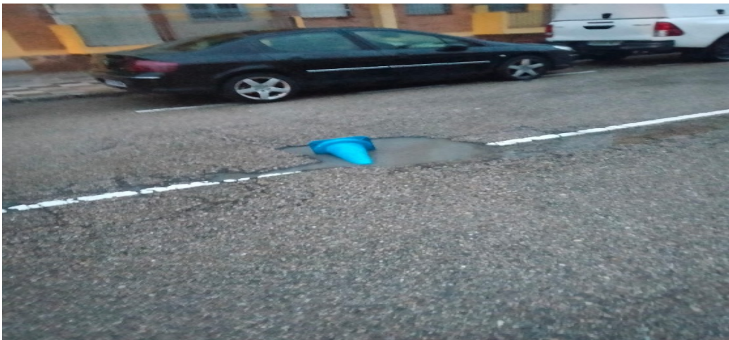
Calle Monte de Garcilligeros.

CUARTO.- Y si en el Ruego nº 3) les trasladamos las molestias para los peatones de las balsas de agua, también les trasladamos el RUEGO por el riesgo que lleva implícito para los conductores de los socavones con agua en las calzadas. Anexamos fotos a título de ejemplo.