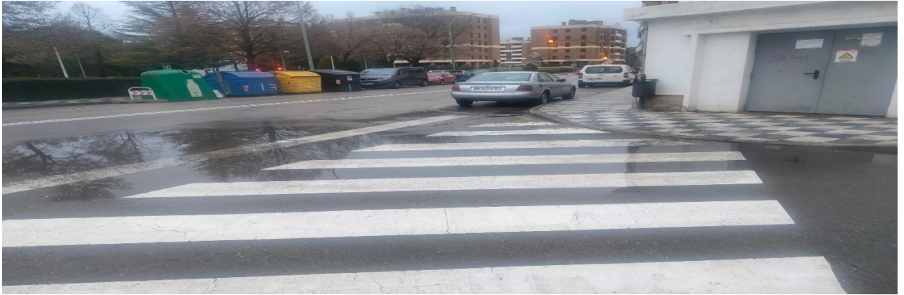
Paso peatones C/ Escritor Florencio Martínez Ruiz y de C/ Hermanos Becerril (Parroquia S. Fernando)