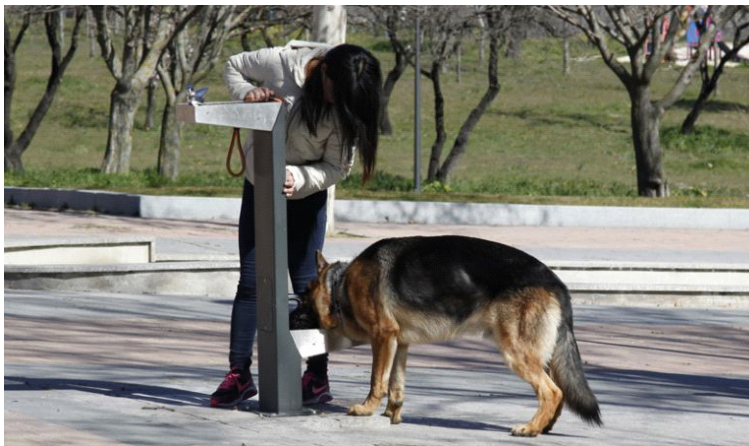
Fuente con bebedero para animales en Getafe.

QUINTO. – Además de las personas, los animales también tienen la necesidad de beber agua. En algunos ayuntamientos se han instalado fuentes con bebederos para que las mascotas también puedan hacer uso de estas.